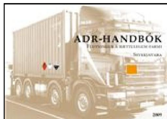
ADR - HANDBÓK Flutningur á hættulegum farmi Stykkjavara Verð: 6.000:-kr.